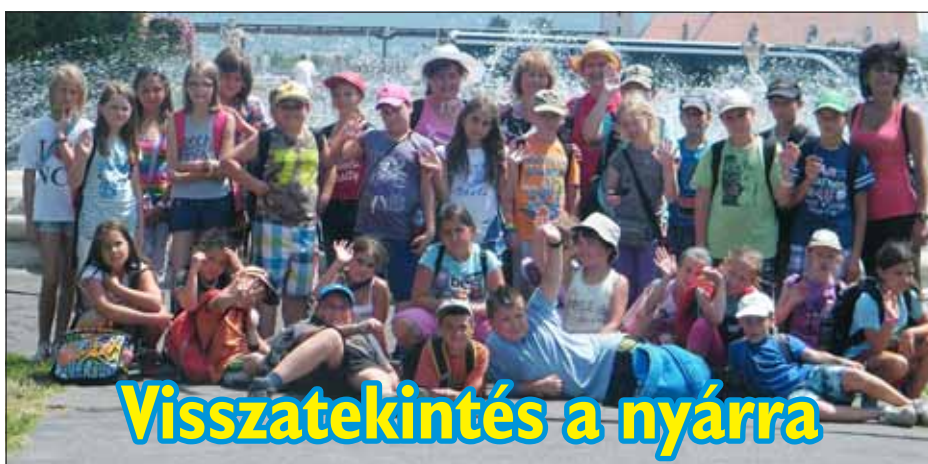
Visszatekintés a nyárra