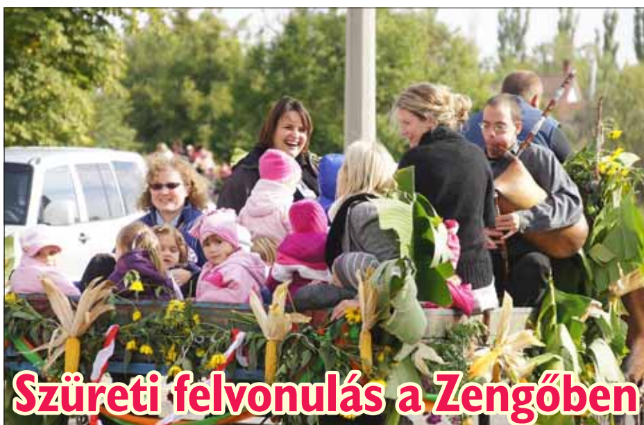
Szüreti felvonulás a Zengőben