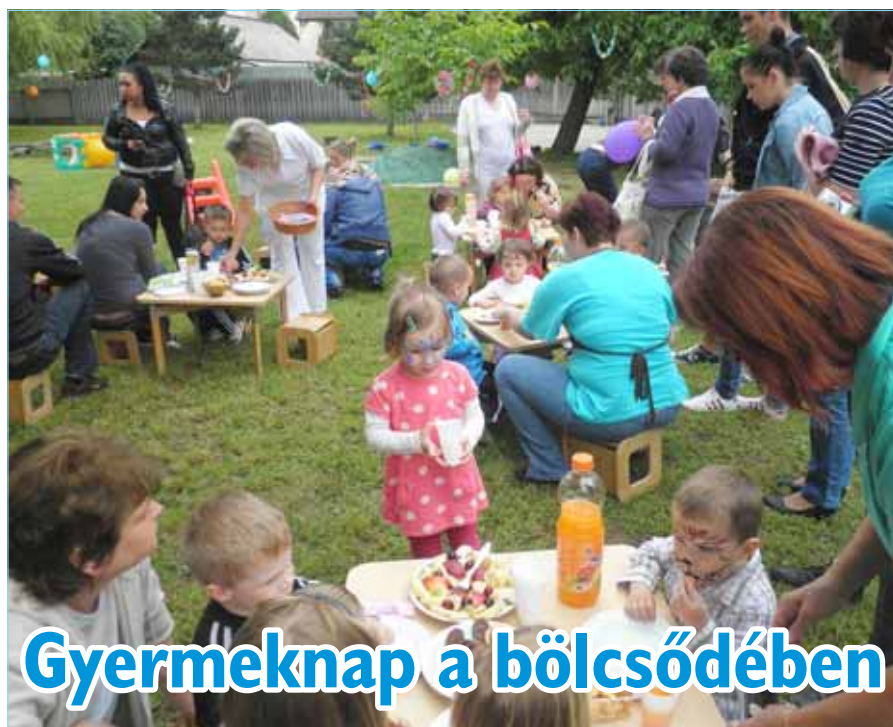
Gyermeknap a bölcsődében