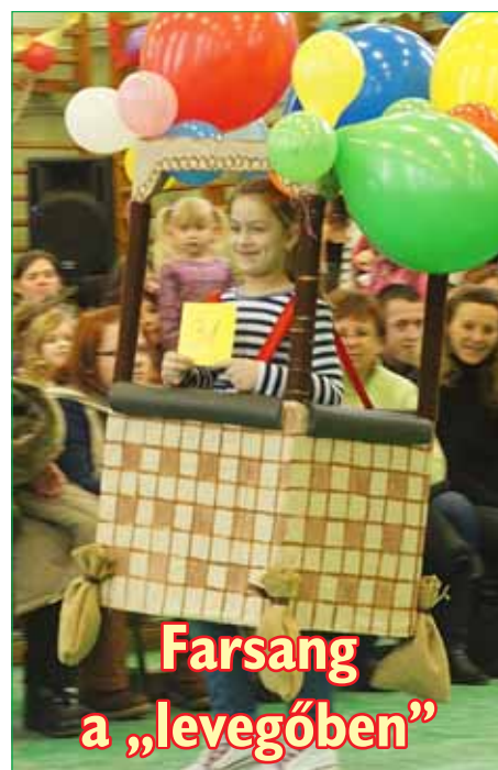
Farsang a „levegőben”