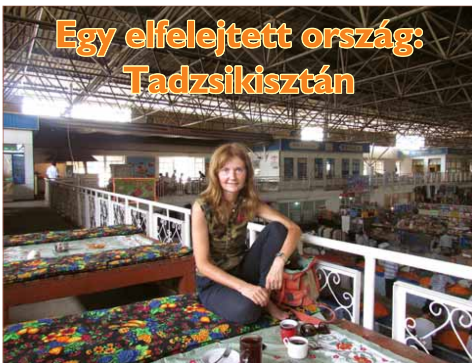
Egy elfelejtett ország: Tadzsikisztán