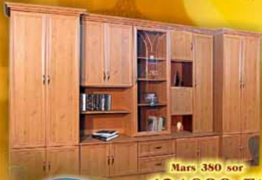
Mars 380 sor 134.900 Ft