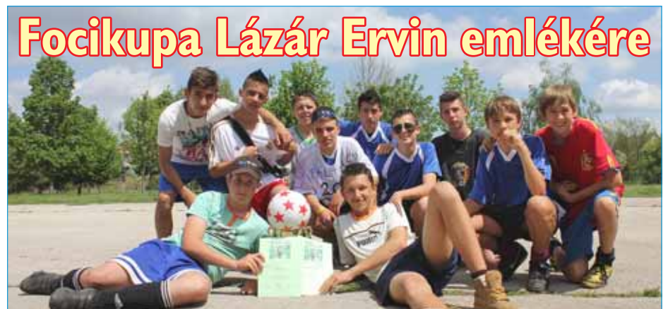
Focikupa Lázár Ervin emlékére