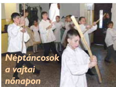
Néptáncosok a vajtai nőnapon