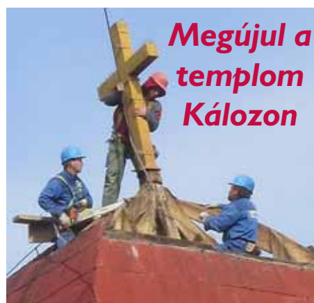
Megújul a templom Kálozon