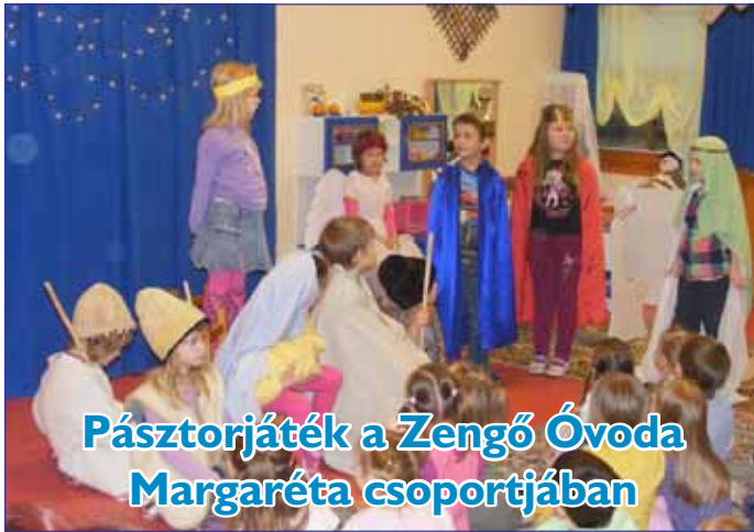
Pásztorjáték a Zengő Óvoda Margaréta csoportjában