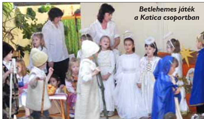
Betlehemes játék a Katica csoportban

A Süni csoport lelkesen készült a Luca-napra versekkel, mondókkal. December 13-án a fiúk legényeknek, a lányok boszorkányoknak öltözve, seprűhátan adták elő a műsorukat a többi hét csoportnak, mellyel nagy sikert arattak. A jókívánásokért cserébe került a tarisznyába mindenféle földi jó, ami a gyerekek kedvence. /Toldy Miklósné/