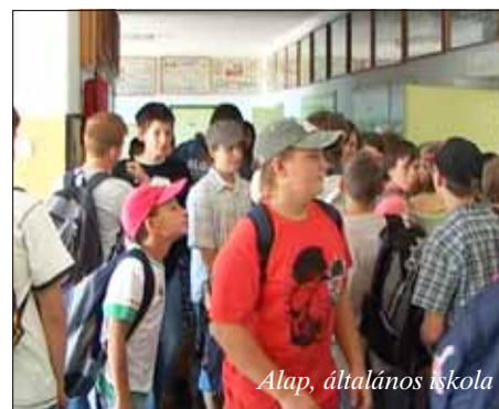
Alap, általános iskola

Nagy Lajos polgármester érdeklődésemre elmondta, hogy ők már megszenvedtek a hetvenes években egy iskola- és faluösszevonást. Abba belerokkant a falu. Többet ilyet nem akarnak. A nagyobb anyagi áldozat árán is inkább kibőjtölik, amíg megváltozik a jelenlegi hibás politikai szemlélet, amely a kis iskolák, a kis települések tönkretételét eredményezi.