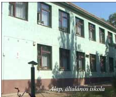
Alap, általános iskola

Alsószentivánon más utat választottak az iskolájuk megmentésére. Tavaly hatalmas anyagi áldozattal és összefogással pályázati pénzek segítségével befejezték iskola-felújítási programjukat. A településen a kor követelményeinek minden szempontból megfelelő nyolcosztályos iskola működik fiatal, képzett tanári gárdával, XXI. századi berendezéssel, felszereléssel. Minden tantárgyat szakos tanár tanít. Ők az is-