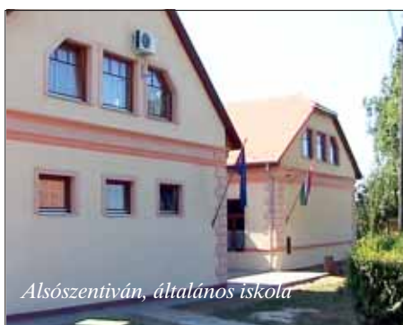
Alsószentiván, általános iskola

Alsószentivánon más utat választottak az iskolájuk megmentésére. Tavaly hatalmas anyagi áldozattal és összefogással pályázati pénzek segítségével befejezték iskola-felújítási programjukat. A településen a kor követelményeinek minden szempontból megfelelő nyolcosztályos iskola működik fiatal, képzett tanári gárdával, XXI. századi berendezéssel, felszereléssel. Minden tantárgyat szakos tanár tanít. Ők az is-