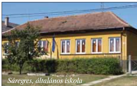
Sáregres, általános iskola

a határozatot. Az utolsó pillanatig remélték, hogy a sáregresi szülők helyben íratják be a gyerekeiket. Sajnos kiderült, hogy a