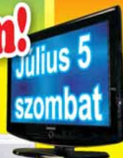
Samsung LE32R82 LCD televízió, 82 cm képátló, 16:9 képarány, HDTV kompatibilis